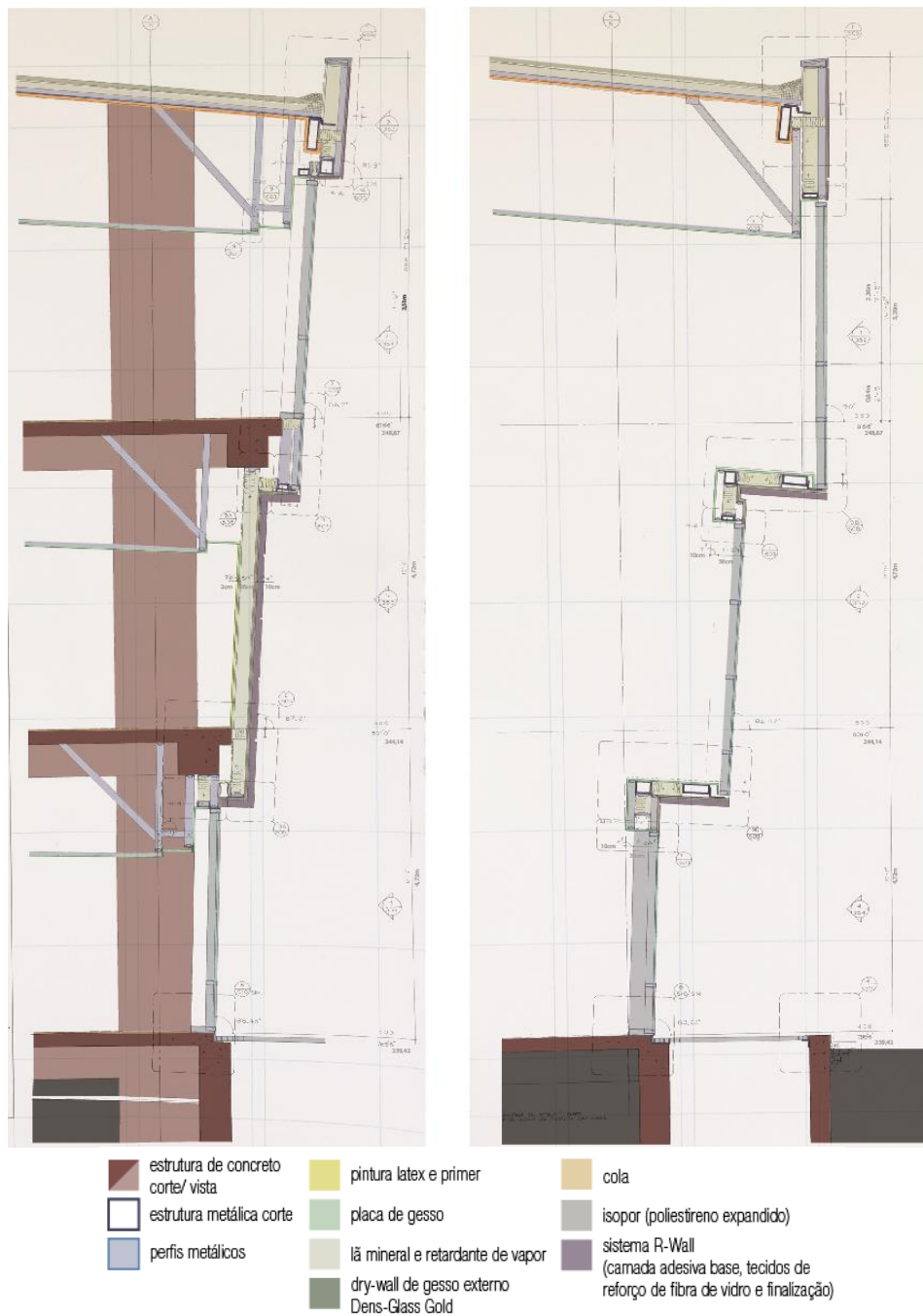
Figura 2: identificação dos materiais nos cortes construtivos - grafismo original feito sobre desenhos publicadas em Davidson (1996, p.122-123)

montantes metálicos, isolamentos em lã de vidro e isopor, seguido por um sistema de isolamento e acabamento externo (EIFS, exterior insulation and finish system ) chamado R-Wall , composto por uma camada interna de isolamento térmico e outra camada de acabamento aplicada sobre um substrato. Friedman defende a beleza de método de um arquiteto que construa a imagem do prédio em resina acrílica pintada e estuque, se referindo ao EIFS como massa onírica, citando Bachelard, 'um materialismo de fora para dentro, no qual a forma é expulsa, dissolvida e apagada' (Friedman, 1996, p.122). Ainda segundo ele, durante a construção, porções molhadas de acabamento caíam das espátulas, levando-o a encontrar no chão muitas dessas pequenas massas desformes, azuis ou rosas (Friedman, 1996, p. 44). Outros autores, entretanto, não são tão benevolentes com a escolha de Eisenman. Kipnis (1996) é um dos que têm uma visão menos poética do material. Para ele, o tal estuque sintético é o equivalente arquitetônico do mingau e do corante comestível. Segundo ele, não-tectônico e vazio de qualquer qualidade intrínseca, o EIFS é do tipo